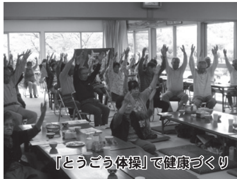
「とうごう体操」で健康づくり

● 注意事項 講座は町政施策などを説明するものであり、要望や苦情などをお受けするものではありません。