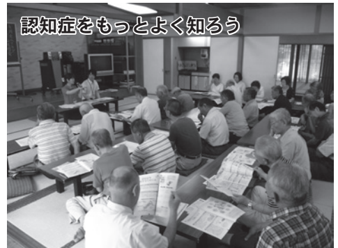
認知症をもっとよく知ろう