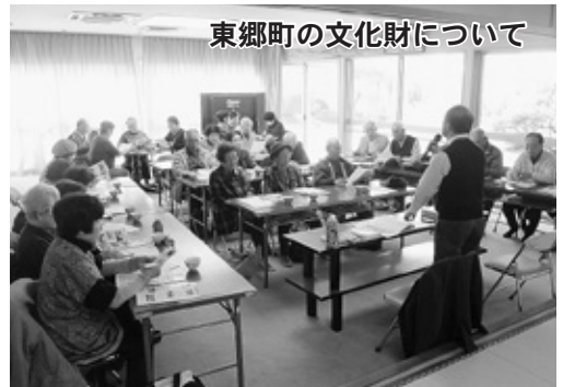
東郷町の文化財について