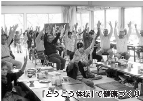
「どうこう体操」で健康づくり

注意事項 講座は町政施策などを説明するものであり、要望や苦情などをお受けするものではありません。