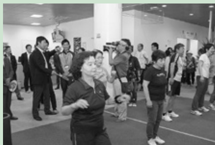
①音響を活用した運動

・文部科学省「幼児期の運動促進に関する普及啓発事業」を全ての町立保育園で実施(平成24年10月) ・町、順天堂大学スポーツ健康科学部、東郷町施設サービス(株)の三者で町民の健康づくりに関する連携協定を締結(平成26年4月) ・厚生労働大臣がいこまい館を健康増進施設に認定(平成26年10月) ・文部科学省「幼児期の運動に関する指導参考資料作成事業」を受託(平成26・27年) ほか