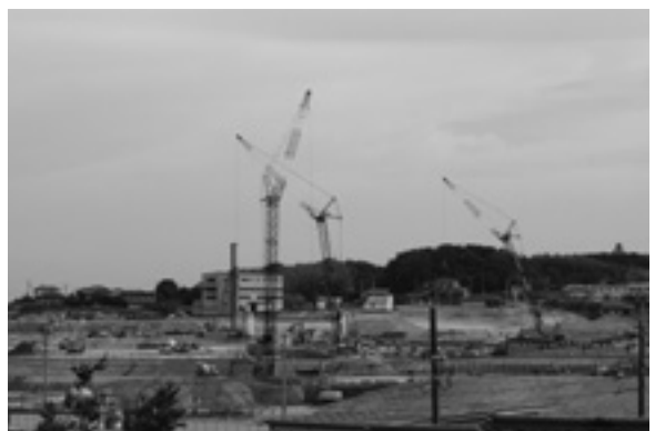
▲ (仮称) ららぽーと愛知東郷町の建設予定地