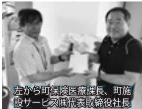
左から町保険医療課長、町施設サービス課代表取締役社長

お薬手帳カバリの提供 町の第三セクターで介護予防や健康づくり教室などを実施している東郷町施設サービス株式会社より、診察券や保険証を入れられるポケット付きカバリーを提供していただきました。