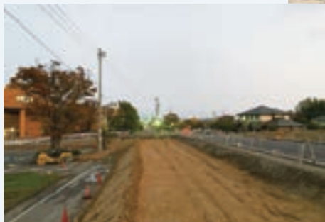
↑工事中の都市計画道路 名古屋春木線

工事は、来年まで続く予定で、車線の切替えなどにより大変ご迷惑をおかけしておりますが、引き続き、ご理解とご協力をお願いいたします。