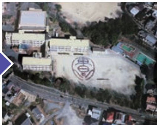
現在の東郷小学校