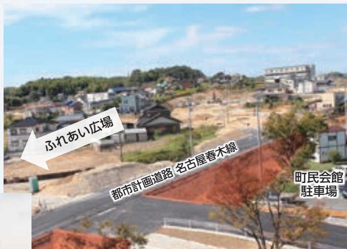
町民会館屋上より撮影 (10月16日時点)