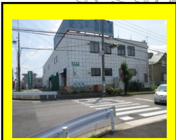
交差点を渡る時は左右をきちんと見ましょう！