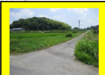
抜け道として使う車が多いので、注意して通行しましょう！