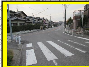
スピードの速い車が通るので、横断歩道を渡るときは気をつけましょう！