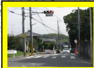
交差点を渡る時は左右をきちんと見ましょう！