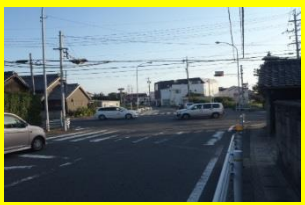
車がたくさん通るので、気をつけましょう！

夜間外出するときは、明るい色の服装で出かけましょう。また、反射板や懐中電灯を身につけ、車からよくわかるようにしましょう。