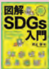
『図解SDGs入門』 村上芽 著