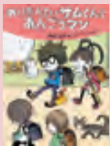
『めいたんていサムくん とあんごうマン』 那須正幹 作

3月の休館日 毎週火曜日と22日(月) ※新型コロナウイルス感染症の状況によって、休館日を変更する場合があります。 ●新着図書 ●一般向け 『図解SDGs入門』 村上芽 著 『気候変動から世界をまもる30の方法』 国際環境NGO FoE Japan 編 『落語でわかる「民法」入門』 森章太 著 『移動図書館の子供たち』 我妻俊樹 著 ●児童書・絵本 『ブレインメンタル強化大全』 権沢紫苑 著 『子育ての経済学』 マティアス・ドゥブケ 著 『めいたんていサムくん とあんごうマン』 那須正幹 作 『絶景のふしぎ100』 佐野充 監修 『わかるかな？小学生の陸上競技ルール』 三浦敬司 著 『ためきのおまじない』 おおなり 修司 文 『見たい！知りたい！図書館はうら側もすごい！』 小田光宏 監修