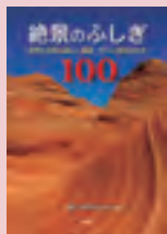
『絶景のふしぎ100』 佐野充 監修