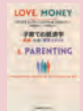
『子育ての経済学』 マティアス・ドゥブケ 著