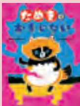
『ためきのおまじない』 おおなり 修司 文