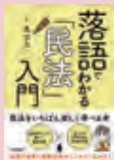
『落語でわかる「民法」入門』 森章太 著