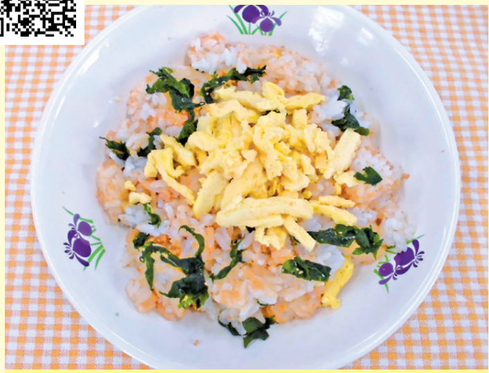
あっさりとした味なので、食欲がないときでも食べやすいです。簡単ですぐに作れるので、ぜひ、家でも作ってみてください。