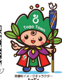
東郷町イメージキャラクター トッピー