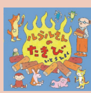
ルラルさんのたきび