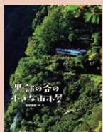
黒部の谷の 小さな小屋