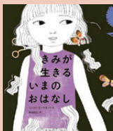
きみが生きる いまのおはなし