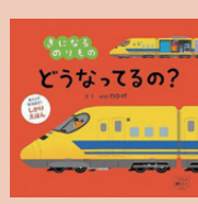
きになるのりもの どうなってるの?