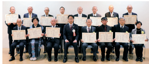
写真は表彰式参加者のみ