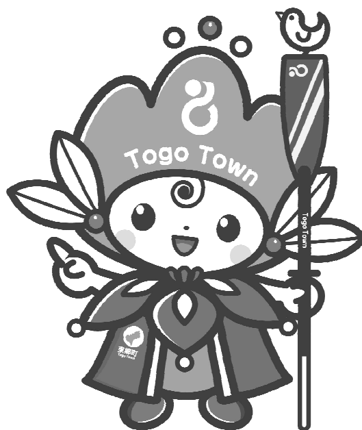
東郷町イメージキャラクター トッピー