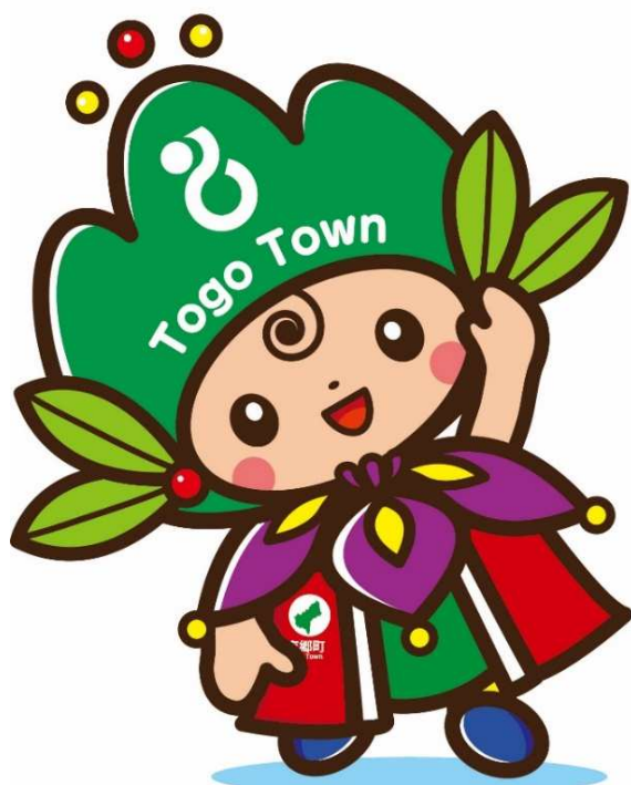
東郷町イメージキャラクター トッピー