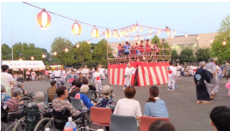
東郷苑での盆踊り風景

愛厚ホーム東郷苑は、昭和39年に開所した県下で最も歴史のある特別養護老人ホーム(入所定員103名・短期入所7名)です。平成3年の改築の際には天皇皇后両陛下行啓されています。平成26年には認知症対応型のデイサービスセンター(東郷庵)を開設し、平成31年には、東郷町より東郷町南部地域包括支援センター東郷苑を受託しました。地域に密着したサービスを展開することにより共生社会を目指した取り組みを行っています。当苑の日常の様子はホームページにブログを定期的にアップしていますのでぜひご覧になってください。