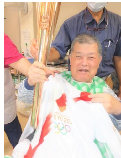
東京オリンピックのトーチ・Tシャツと共に