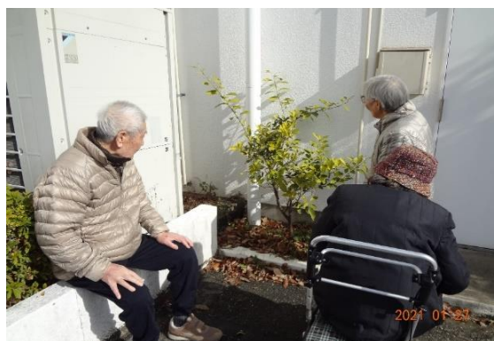
天気がいい日は日光浴