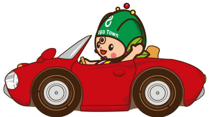
東郷町イメージキャラクター トッピー