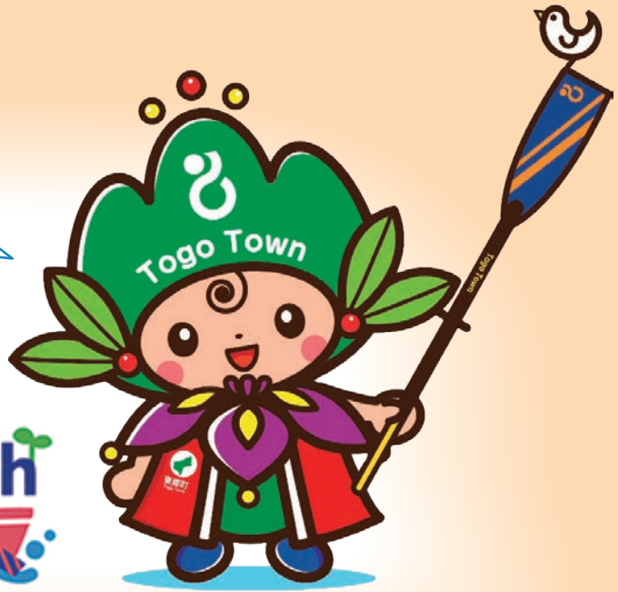
東郷町イメージキャラクター トッピー