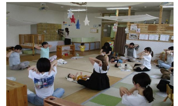
R7.7.9ママストレッチの様子