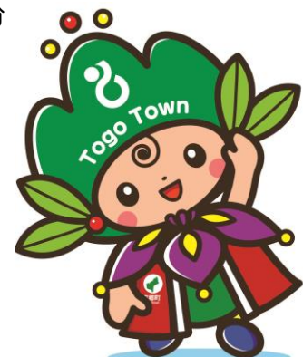
東郷町イメージキャラクター トッピー

ホームページ http://www.town.aichi-togo.lg.jp/