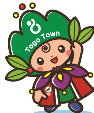
東郷町イメージキャラクター トッピー

ホームページ http://www.town.aichi-togo.lg.jp/