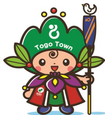
東郷町イメージキャラクター トッピィ