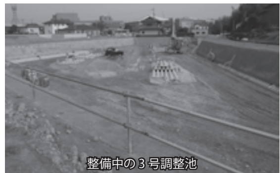
整備中の3号調整池