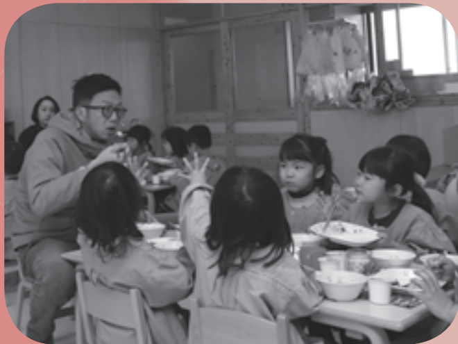
▲生産者と給食を食べる園児の様子