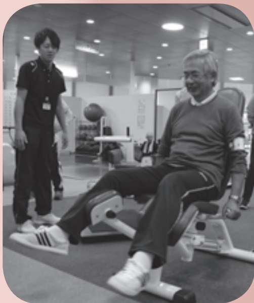
▲健康づくり教室の様子