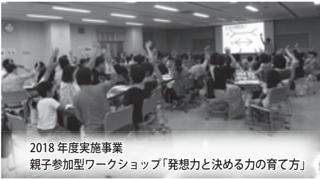
2018年度実施事業 親子参加型ワークショップ「発想力と決める力の育て方」

● その他 詳しくは、町ホームページ「ホームVくらし・防災V町民活動V協働によるまちづくり提案事業V平成31年度協働によるまちづくり提案事業」をご覧ください。