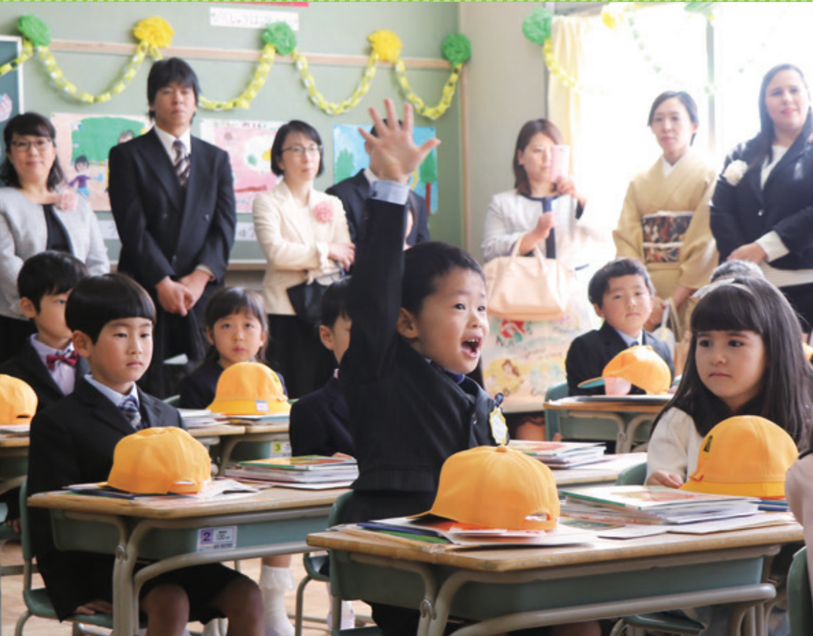
入学式（4月5日、諸輪小学校）