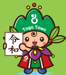
東郷町イメージキャラクター トツピイ