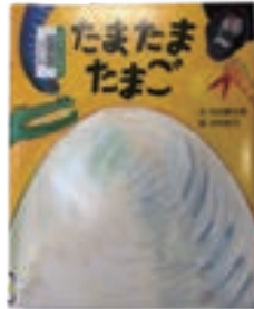
「たまたまたまご」 内田麟太郎 文