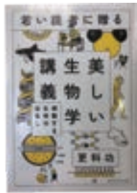
「若い読者に贈る 美しい生物学講義」 更科功