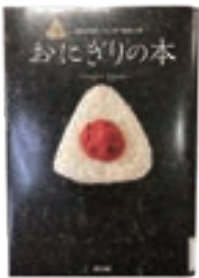
「おにぎりの本」 おにぎり協会 監修