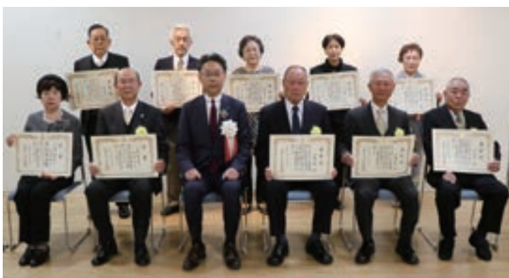
写真は表彰式参加者のみ。