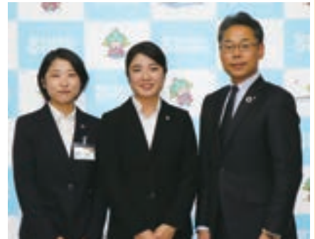
左から原さん、織田さん、町長