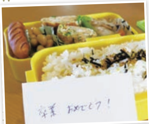
【参考作品】題名：我が家の愛情弁当