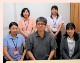
南部地域包括支援センター東郷苑 （愛厚ホーム東郷苑内）