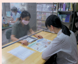
北部地域包括支援センター （いこまい館2階）

認知症サポート医は、認知症に関する研修を受講した医師です。本人とその家族が住み慣れた地域で安心して暮らせるようお手伝いします。