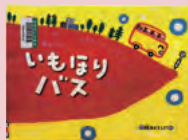
『いもほりバス』 藤本ともひこ 著