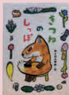
『きつねのしっぽ』 おくはらゆめ 著