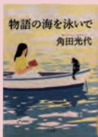
『物語の海を泳いで』 角田光代 著