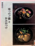
『味つけご飯とおみおつけ』 重信初江 著