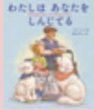
『わたしはあなたをしんじてる』 リサ・パップ 作