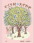
『さくら村は大さわぎ』 朽木祥 作