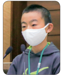
中川 泰我 議員

現在、株式会社モンシエールと協力して東郷町産のお米を使ったオムレットやロールケーキを開発しており、販売も含めて広くPRする方法を検討しています。学校給食で提供されているお米のタルトは、給食での楽しい思い出を感じることができ、皆様に馴染み深いものであることから、文化産業まつりを始めとした町内のイベントで販売できるように関係者の方々と協力していきたいと考えています。