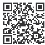
▲カタログポケット