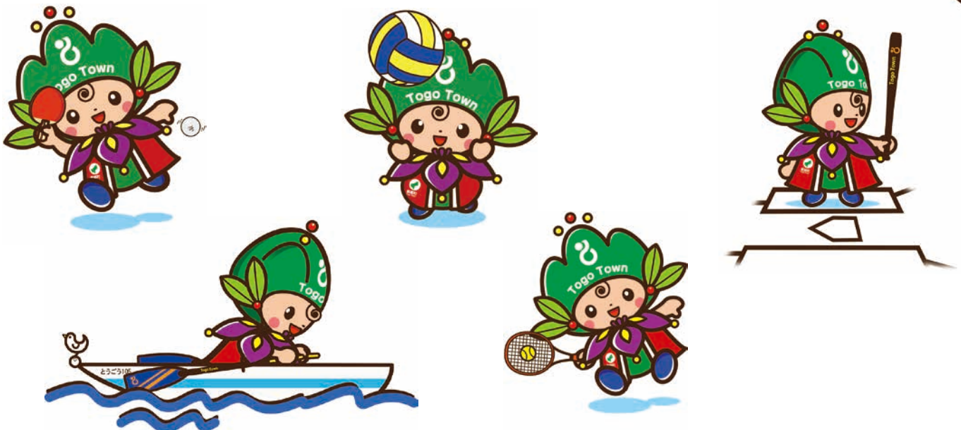
東郷町イメージキャラクタートッピー