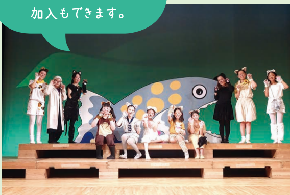
R4子どもミュージカル「11ぴきのネコ」より