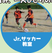
Jr. サッカー 教室