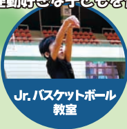
Jr. バasketボール 教室