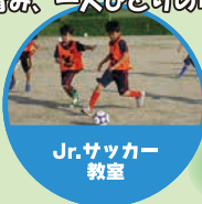
Jr. サッカー 教室