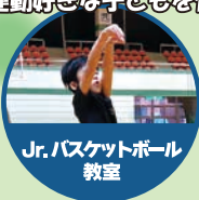
Jr. バasketボール 教室