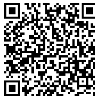
「役場へのお問い合わせ」フォーム