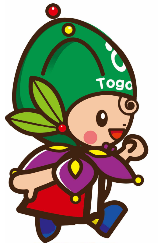
東郷町イメージキャラクター トッピー