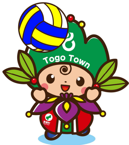
東郷町イメージキャラクター トッピー

お寄せいただいたご質問はQ&Aとしてとりまとめ、順次ホームページに掲載いたします。