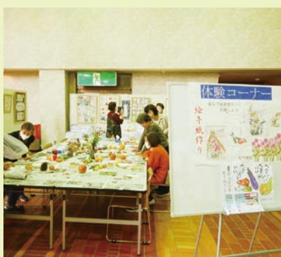
絵手紙部の体験コーナー