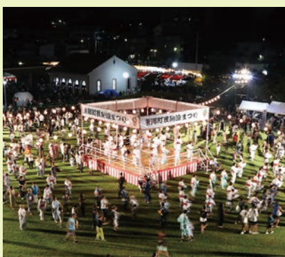
やぐらを囲んで行う盆踊り