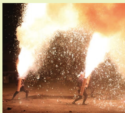
町商工会による手筒花火

問い合わせ／生涯学習課 生涯学習係(町民会館内) TEL 0561-38-6411