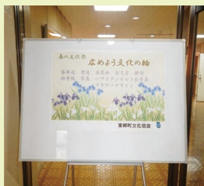
春の文化祭に出演した文化協会の部会