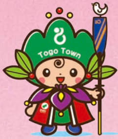
東郷町イメージキャラクター トッピー