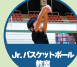
Jr.バスケットボール 教室