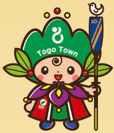
東郷町イメージキャラクター トッピー