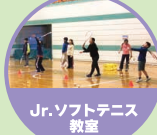
Jr.ソフトテニス 教室