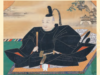
徳川家康像(大阪城天守閣蔵)