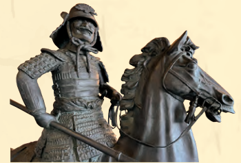
丹羽氏重像(岩崎城歴史記念館蔵)