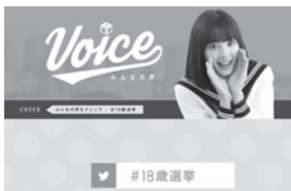
夏の参院選から適応 総務省ホームページより

【生活部長】普段からの家族のコミュニケーションが大切。家族や専門家へ相談する事を啓発していく。消費生活相談員による老人クラブへの出前講座や旬の事例を挙げての啓発チラシの回覧・配布を行っている。地域サポーターとの連携も必要。