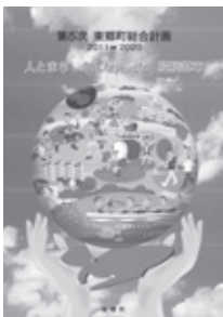
第5次東郷町総合計画の冊子

【問】らぽーとを誘致した三郷市は、年間34億円税収増が図られたと聞く。税収増加には新たな仕掛けが必要、他市から訪れるイベント、ビアガーデン開催等の仕掛け、調整区域の有効活用、大学誘致。営業、戦略、税収増を狙った部署の新設を。【企画部長】ご意見として承り参考とさせて頂く。