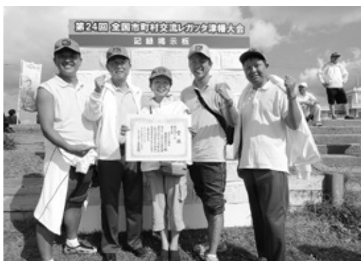
議会議員の種目 3位入賞チーム

平成27年9月26日・27日石川県津幡漕艇競技場で、全国26市町村130クルーが参加して大会が開催されました。東郷町から各種目（8クルー）出場し、東郷町は総合11位の成績でした。議会の部では3位入賞。 26日の競技前に、全国ボート場所在地市町村協議会 加盟市町村議会 第11回議長懇話会が開催され、平成28年埼玉県戸田市で9月17日・18日、平成29年秋田県由利本荘市、平成30年滋賀県大津市で開催決定の報告、各市町村の報告、名誉顧問からの助言として（女性クルーの数が増加傾向にあり嬉しい現象である。また、五輪の事前キャンプの誘致には、英語のHPをつくるのが第一である）とのことでした。津幡大会を通してボート交流と「ボートの町とうごう」を全国発信することが出来ました。 議長懇話会会場