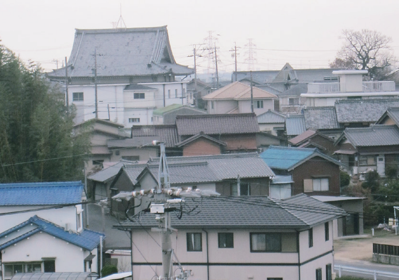
傍示本地区の町並（町民会館屋上からの風景）