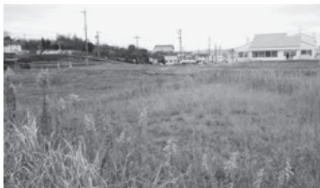
新設保育園予定地 (左奥は諸輪保育園、右奥は東部児童館)

【問】少人数学級の効果は。 【教育部長】生徒一人ひと りに目が行き届き効果的 に学級運営ができる。 【問】35人学級を実施する 学年を拡大し、さらに30 人学級にする考えは。 【教育部長】どの学年から するのが問題。全学年 で実施できればいいが今 は考えていない。30人学 級は全学年で35人学級を した後に考えるべきだ。 【教員の労働時間】 【問】過労死など防止のた めの取り組みは。 【教育部長】個人別在校時 間状況シートで在校時間 を把握。授業以外にも色 々な事務等が増え学級運 営のための臨時職員を採 用。部活動は学外指導者 採用、第3日曜日の活動 自粛などで負担を軽減。 【マイナンバー制度実施】 【問】個人番号記載が求め られる役場への申請で、 何らかの理由で個人番号 を書かない人の書類も受