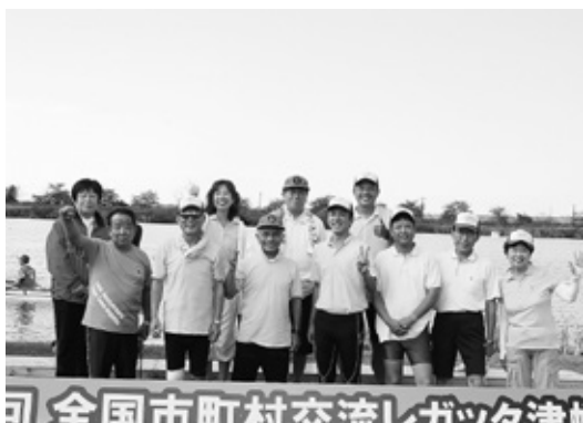
東郷町議会議員大会参加メンバー