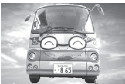
とうごうチャンネル 案内役の「じゅんかい君」