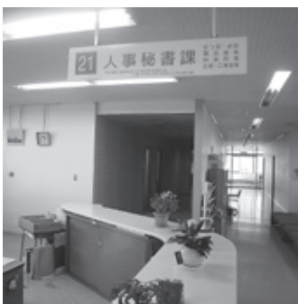
役場人事管理の担当課