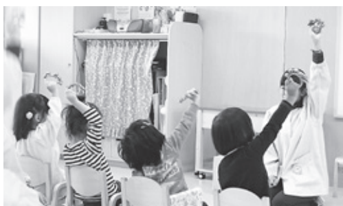
「ハーモニー」の朝の会の様子

【問】利用状況は。 【福祉部長】 現在16名。うち7名が単独通園。 【問】児童や保護者への支援内容は。 【福祉部長】 児童へは、作業療法、音楽療法などを行っている。保護者へは、勉強会や講演会等を行う。 【問】ひよこルームの設置目的、役割は。 【福祉部長】 待機児童の解消を目的に開設した。 【問】利用状況は。 【福祉部長】 現在7名。年度内に9名となる予定。 【問】運営費は。 【福祉部長】 子ども・子育て支援新制度で国から450万円、県から225万円の補助金が交付される。 【問】3歳で転園する時はどうなるのか。 【福祉部長】 保護者の希望を勘案し、町内の保育園へ転園する。 【問】今後の展望は。 【福祉部長】 待機児童がいる限り必要と考える。 【問】取り組みの効果は。 【福祉部長】 子どもは自立し、保護者は時間に余裕ができて、様々な効果が出てきた。 【問】中部保育園内にあるメリットは。 【福祉部長】 園庭で遊んだり、園の行事にも参加して交流もでき、発育・発達に効果が見込める。また、保育園内にあるため、通わせやすく、様々な効果が期待できる。 【問】今後の展望は。 【福祉部長】 土曜日療育や午後3時から療育等を検討していく。