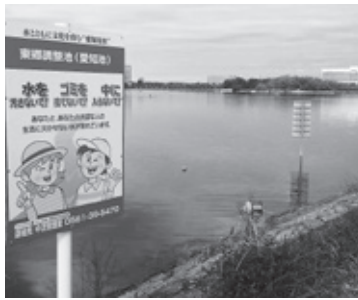
レガッタも行われる愛知池

【企画部長】オンライン回答数は、全国で約190万件、回答率は36.9%。都道府県別の回答率は、愛知県は45.1%と全国4位。本町は、愛知県内で、第6位程度に位置。