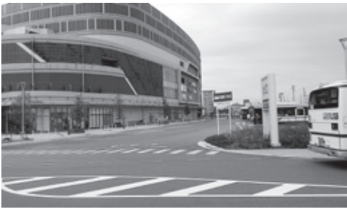
イオンモール名古屋茶屋のバスターミナル

【総務部長】住民からの要望には2週間を目途に回答すること、自治区からの要望には1カ月以内の回答すること、など期限の明確化を示すことと考える。