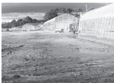
株マイファーム社の実習農場 畝立て前の畑と施設園芸用温室群

【経済建設部長】耕作放棄地活用や新規就農者の育成など期待している。ベンチャー企業とも連携し、担い手確保に努めたい。