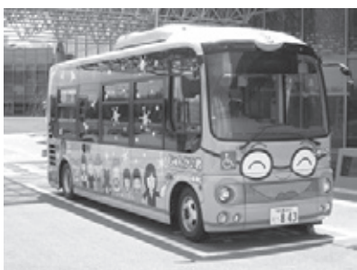
より高い利便性が求められる巡回バス

できた道路を通り西白土・トミーを通り、名古屋諸輪線から「うらぼーと」を経由し、和合ヶ丘・白鳥・御岳・諸輪と進めば町の東西から赤池駅に行くことができるようになる。イオン三好店までつなぎ、イオンをはじめ赤池にできるイトーヨーカ堂や「うらぼーと」と連携すれば、経費上の問題も小さい。 【生活部長】提案として新しい視点を頂いたので研究したい。