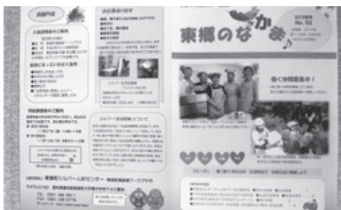
シルバー人材センター機関紙

【問】いこまい館内の無声映像コーナーの考えは。 【企画部長】 今後、「とうごうチャンネル」が巡回バス待ち等に観られるよう施設関係者と協議し、検討する。 【問】指定管理者制度導入後の現況は。 【教育部長】 子育て支援としてキッズ版のたよりを発行。パソコンによるインターネット検索や高齢者向け図書宅配サービス。主な施設に特別返却窓口を設置など。 【問】子どもや高齢者に対する今後の取組みは。 【教育部長】 貸出数や返却窓口増設等を調査研究し、読みたい図書検索システムの充実を図りたい。