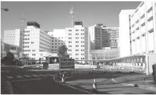
第3次救急医療施設 藤田保健衛生大学病院

【総務部長】藤田保健衛生大、愛知医大の第3次救急医療施設と連携体制の構築や隣接地への出勤時間短縮など。構成市町増加にて意見集約や調整に時間を要する。