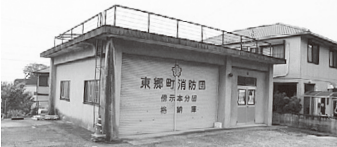
東郷町消防団傍示本分団の詰所

【経済建設部長】雨水貯留タンクの設置件数は、年々減少気味で、治水対策拡充のために検討したい。