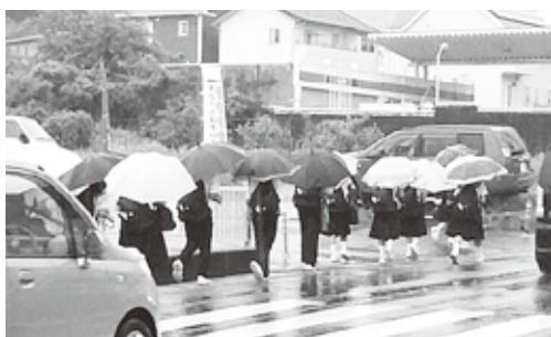
安全対策が必要な新池交差点

※この他に、県道整備における町の優先順位の考え方その他、大学入試改革に伴う町教育局の対応について質問しました。