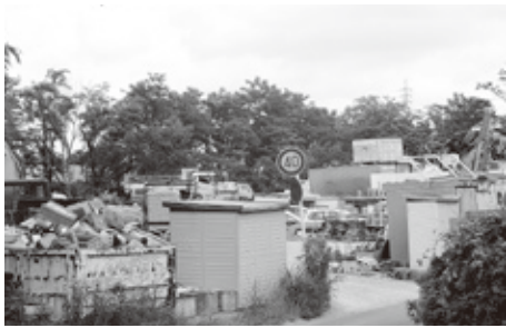
愛知池周辺にある監視が必要な資材置き場

以上の地震を覚知した場合、全職員は自主参集する。想定外の事態の発生も想定しながら災害対策にあたる必要がある。 【問】大量の倒壊家屋や転倒家財の処分や集積する場所の確保が必要であるがその対応は。 【総務部長】一時的な廃棄物の仮置き場での廃棄物保管も必要となる。本町と一般社団法人愛知県産業廃棄物協会と「災害時における廃棄物の処理等に関する協定」を締結しており災害時に発生する廃棄物の撤去、収集、運搬、分別及び処分の協力を要請することができる。