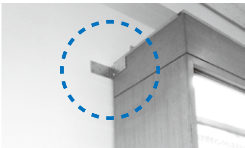
家具の転倒防止対策（役場1階ロビー）

【問】コミュニケーションセンターでの避難所開設が遅れないための家具転倒等の対応状況は。【総務部長】把握していない。駐在員会議等で確認したい。