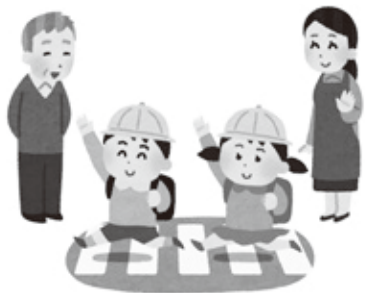
地域の方の協力が子ども達の感謝の心を育む

任体制が明確になった。 【問】 教育長の考える本 町学校教育の良い所は。 また、学校と地域のつな がりについての考えは。 【教育部長】 本町学校教育の 良い所として、田植え等 の体験学習や社会見学を 多く取り入れており、そ のような体験が郷土愛に つながると思う。また、 子ども達が地域の方の協 力に感謝をすることが優 しい心を育てている。各 種行事、会合を通して地 域と強いつながりができ ている。