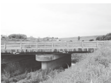
耐震工事予定の篠木橋橋向に愛知池堤防望む

【問】制度の今後の計画と利便性PRについて問う。 【企画部長】来年7月から他市町行政機関同士の情報連携も開始され、利便性と効率性が一層実感できるようになり広報等で普及に努めたい。