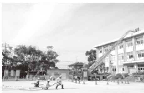
東郷町総合防災訓練（春木台小学校にて）