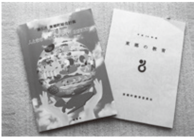
第5次総合計画中間期に 東郷の教育プランを確認

【問】 個人情報であるが、 保管や運用の留意点は。 【福祉部長】 母子手帳や障 がい者手帳と同様、大切 に保管して頂きたい。 【問】 特別支援コーディネ ーター制度採用状況は。 【教育部長】 採用は教育主 任あるいは校務主任が兼 務する場合が多い。児童 生徒への適切な支援のた めに関係機関等と運営調 整し、共同的に対応する よう指名している。 【問】 放課後や長期休暇中 デイサービスの現況は。 【福祉部長】 利用日数は増 加傾向にあり受入れ体制 の拡充が必要。