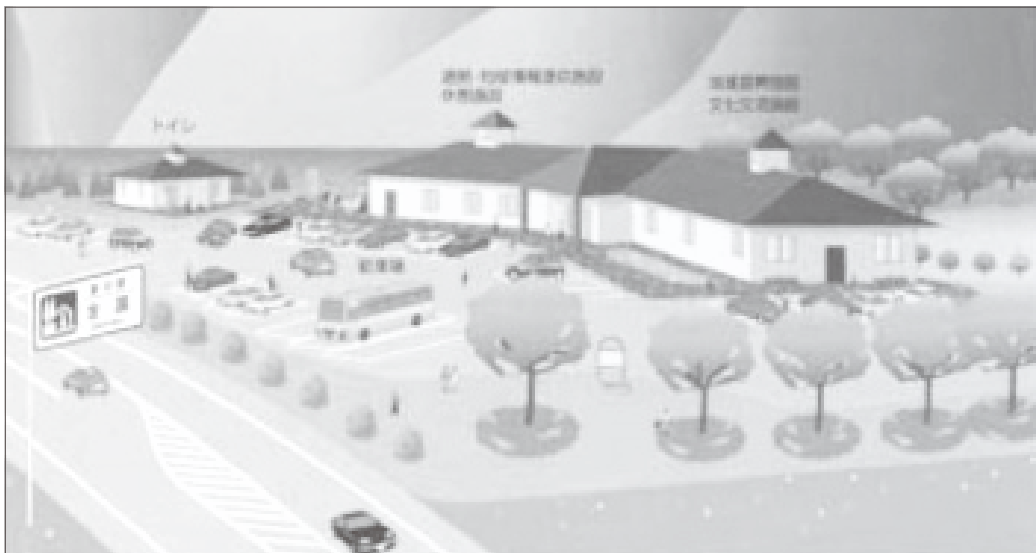
国土交通省「道の駅イメージ図」

〈総務経済委員会修正案〉平成28年度に実施する、考え方や方向性を示すための市場調査を含めた導入可能性調査などを実施する基本構想の策定委託までの部分を原案通り承認し、平成29年度に実施予定であった基本計画策定の部分の債務負担行為734.4万円を削除したもの。