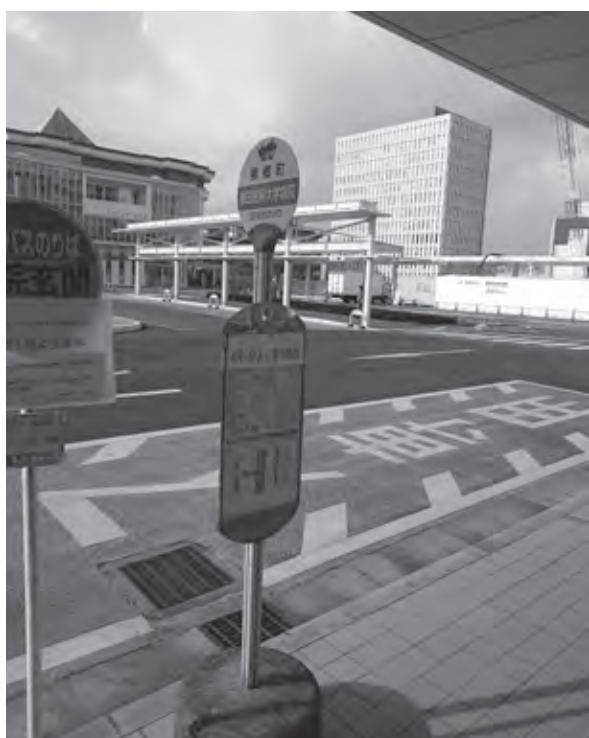
東郷・藤田医大バスの「藤田医科大学病院」バス停