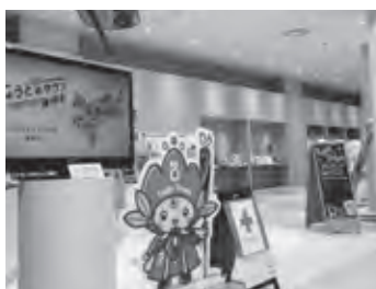
東郷町のプロモート役を担うリーブルトウゴウまちの窓口

【企画部長】集客力が高い施設なので町の魅力等を町内外に発信していく上で有用と考えている。3年度から本格的な運用により、交流人口や定住人口増を促進し、ふるさと納税返礼品等を積極的に発信することで地域経済の活性化につなげたい。