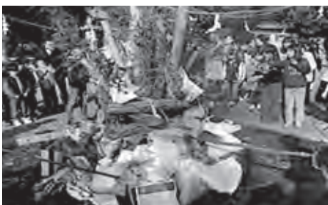
失われつつある地域行事「左義長」等