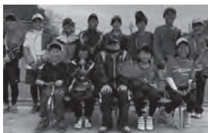
地域のスポーツクラブ（部活動との連携で指導者育成を！）

【総務部長】会議および資料の内容を踏まえ、配布する場合の基本的な取り扱い方法等、現在、検討を進めている。