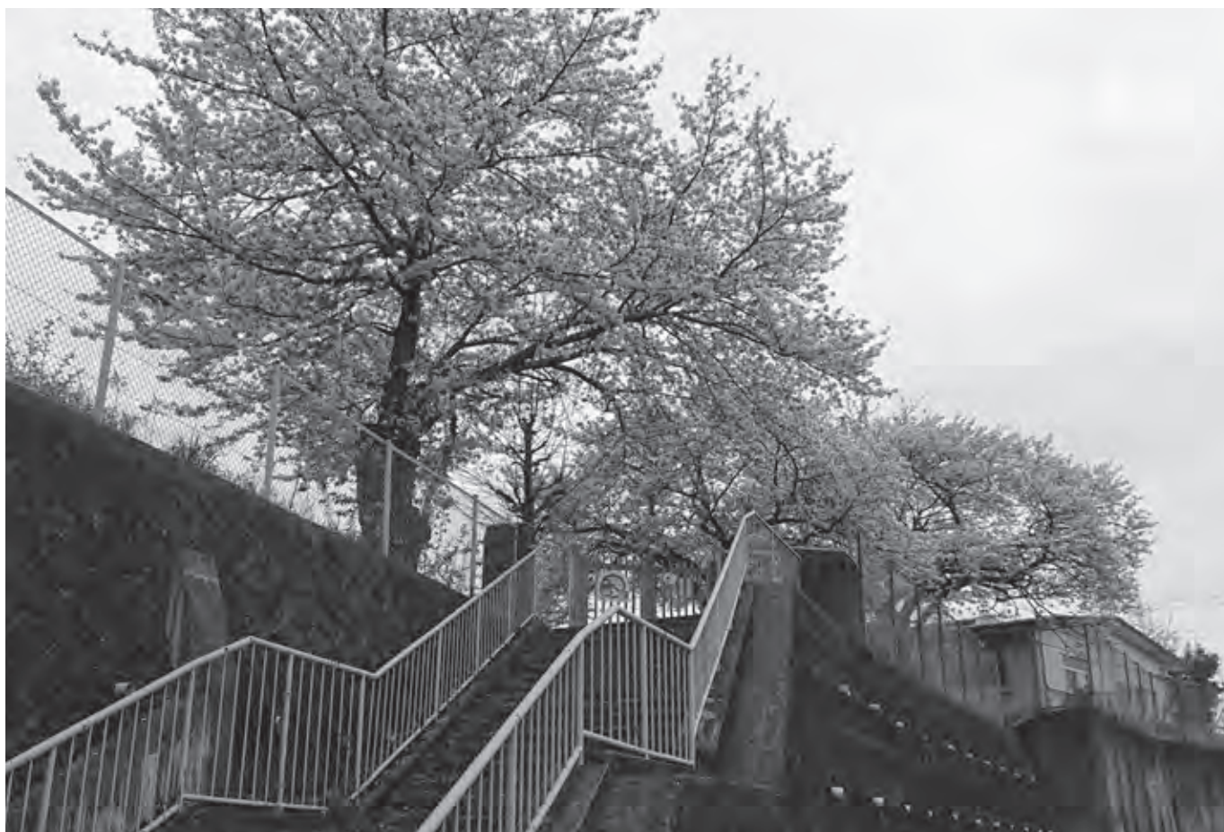
上城さくら公園になる上城保育園跡地の桜

修正の内容は、歳出から健康度（フレイル）チェックの事業費を削除するものです。修正部分を除く原案は全会一致で可決されました。