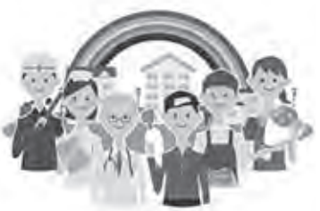
高齢者・独居者は地域全体で見守りを