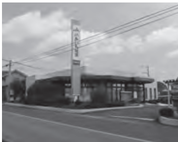
地元にも有効活用が期待される旧JA諸輪支店

【経済環境部長】町民のみなさまにとつて有効な活用ができるよう、JAと協議を進める。