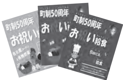
愛知県産食材を使用した「お祝い給食」

【教育部長】当初から6回の提供予定であったが、名古屋コーチンや県産牛肉が提供されることになり食育の機会にもなるため「お祝い給食」で使用するこ