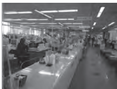
感染症対策をした役場窓口

【こども健康部長】町内で検査が受けられない事例は聞いていない。【問】私が発熱したとき