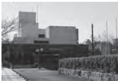
2026年度に移転する愛知県総合教育センター（諸輪上鉾）

【企画部長】東郷町地域公共交通計画の3月末の策定を目指す。4月から巡回バスの再編、乗継無料券配布、バスロケーションシステム導入、藤田医科大学病院へのバス路線の運行を開始。デマンド型交通等新たなモビリティの導入を引き続き取り組む。