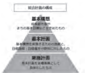
第6次東郷町総合計画の構成

【企画部長】地域やボランティアの方々による運行は、基本的に公共交通会議の承認事項ではない。