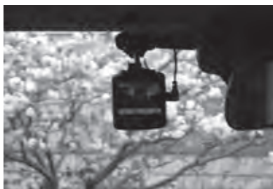
交通安全対策で、ドライブレコーダーの購入・設置費用の補助

【総務部長】一人暮らしの高齢者で、緊急通報システムを設置されている方の内、携帯電話をお持ちでない方が対象。災害情報の入手が困難と考え、緊急事態時に、災害情報が即時に入手でき、速やかに避難行動をとってもらうため。