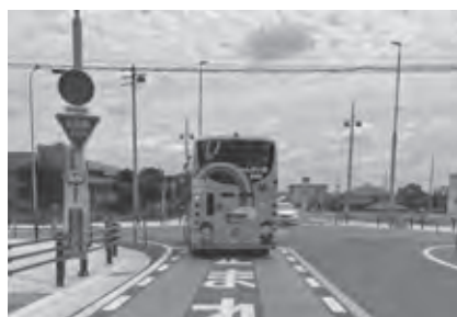
事故が多発する役場西交差点

【問】信号機の設置について、要望先と時期は。 【総務部長】昨年10月5日に愛知警察署長宛に提出し、設置予定は秋頃までと回答があった。