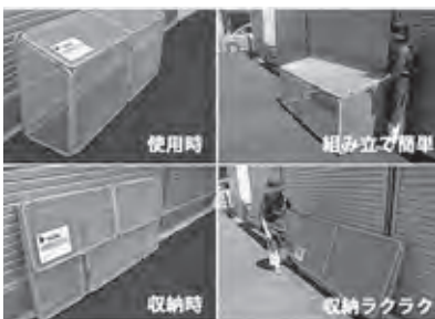
話題の便利なカラス除け

【町長】近隣市からの情報がある。どのようなかたちで、安全対策を取りながら環境美化を進めるかを研究しているが、これがあれば、全て解決すると言うものではない。