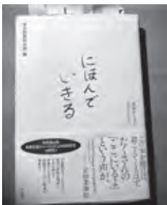
外国籍の子どもの学ぶ権利を問う

【教育部長】対象児童の諸輪小1人に1名、高嶺小13人に2名の日本語教育適応学級担当教員を配置。支援体制拡充への体制づくりと人材の確保が必要。