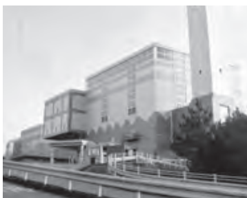
広域化計画で尾三衛生組合はどうなるか

【企画部長】バスターミナルの発着と結節及び近接する鉄道駅への乗り入れを軸に民間のバス路線を含めた全体バスの利用状況をもとにより効率的で利便性の高い運行を目指した。見直しは一定期間の利用状況分析が必要。