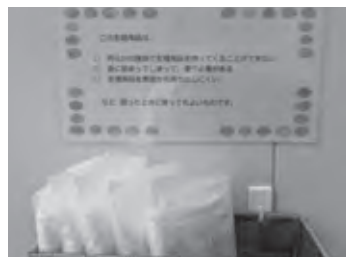
町立小中学校の女子トイレの生理用品 (常備されることに！)