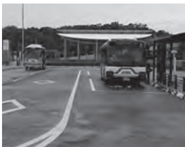
ららぽーとバス停前

【問】介護施設などと同じように保育施設でも新型コロナウイルスの検査を実施する考えは。【子ども健康部長】ない。これまで通り、しっかりと感染症対策をする。