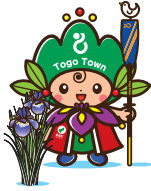
東郷町イメージキャラクター トッピー