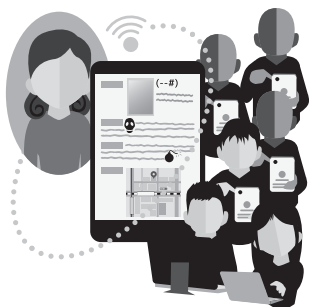
個人情報保護イメージ

【企画部長】総務省からは技術的助言として各自治体に住民票の申請における厳格な本人