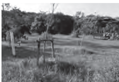
枯れた木も目立つ百年森公園

【問】愛知池には7.4kmのウォーキングコース、百年森公園がある。本町の魅力発信・福祉向上の観点から更なる整備が必要と考えるが。 【経済環境部長】愛知池の管理者である「独立行政法人水資源機構」を交えて検討する。 【都市建設部長】百年森公園に植樹した樹木の一部が枯れており今年度に植替えをする。 【問】町内22力所のため池を見て廻った。池の周りに「雑草・竹林・雑木」が、池の中は「ヨシ・雑草・睡蓮」が繁殖している。人的・資金面の支援が必要では。 【経済環境部長】現状は、雨水を貯蓄し農業用水の安定供給に活用。池の保全・柵の保