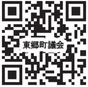
東郷町議会 議会ウェブサイト