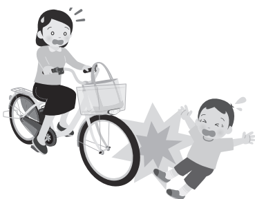
万が一。備えあれば患いなし。

【子ども健康部長】現在、相談はないが、あった場合必要に応じた支援策を研究したい。