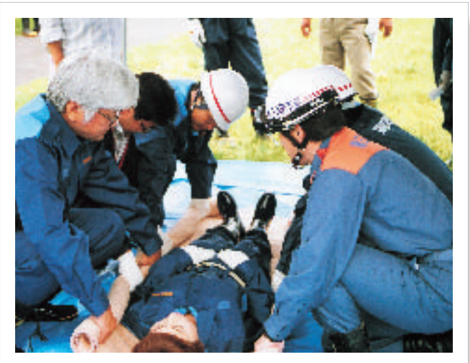
東郷町水防訓練(境川河川敷にて)