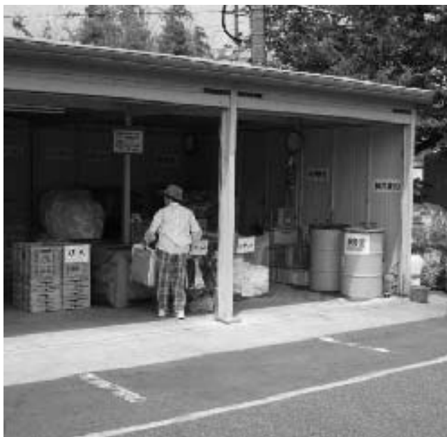
中部資源回収ステーション

Q 焼失以来3年経過した。再建を望む声は多いが状況は。 A 建設用地確保が最大の課題。用地をご提供いただける地権者と、付近住民の承諾を得られるよう努めてまいります。