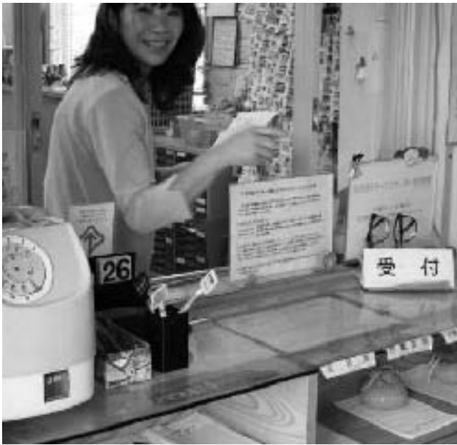
住民窓口サービスセンター

Q いこまい館の具体的改善点として①運動浴の利用方法・利用時間の見直し、②介助浴室の利用方法の見直し、③駐車場不足問題などがある。対策が遅いのではないか。 A 細かな問題は様々であり、速やかに対処してきたと思う。利用方法の変更などでは全体の見直し