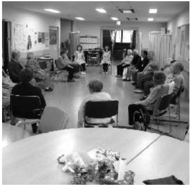
福祉センターでのデイサービス

Q 介護保険の認定を受けても利用しない人がいるが、東郷町では何人か。その理由の把握は。 A 平成20年3月末現在では、認定者883人。サービス利用者633人(利用率約71%)であり、利用していない人は250人。入院中で退院後のために申請した人があるが、その他の理由は把握していない。