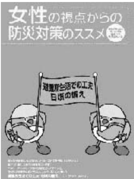
防災対策のパフレットより

Q 介護保険の認定を受けたい A 平成20年3月末現在では、認定者883人。サービス利用者633人(利用率約71%)であり、利用していない人は250人。入院中で退院後のために申請した人があるが、その他の理由は把握していない。