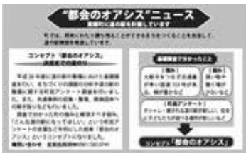
現在の主な情報媒体は広報 (「広報とうごう2018年3月号」より)