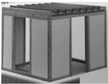
頑丈で安全な室内型耐震シェルター