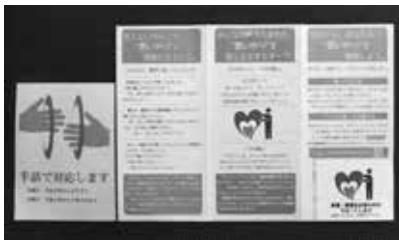
窓口の案内と「サポートハートマーク」のリーフレット