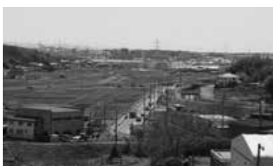
愛知池堤防から周辺の環境と県道岩作諸輪線