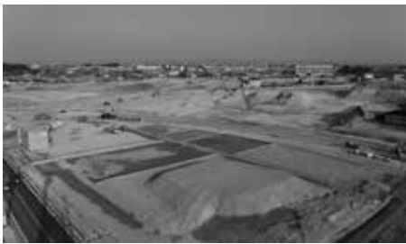
31年度末完成の2つの道路と商業施設

海線に幅員18mの新たな県道が交差する、セントラル地区の学区は。【経済建設部長】将来の計画人口を踏まえ、新たな小・中学校の必要性を教育委員会とも協議した結果、東郷小学校、東郷中学校で対応可能と判断している。