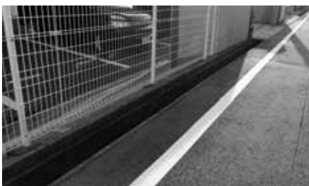
兵庫小学校周辺の側溝

【経済建設部長】子供に限らず町の道路に管理瑕疵があり怪我をされた場合町が責任を負う。側溝に蓋がないだけで、責任を負うことはないが慎重に対処したい。