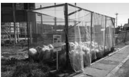
住民手づくりの集積場所