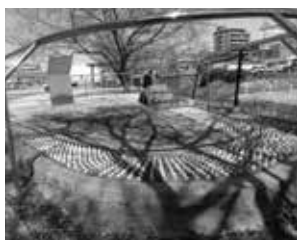
利用者増が期待されるいこまい館の「健康の道」

【問】賑わい創出の「セントラル開発」と「道の駅」その効果と「本町の目指す街づくり像」を問う。 【町長】本町が愛知県の中心となり、「らぽー」と「道の駅」の相乗効果で賑わいを創出し、将来勝ち残れる街を目指したい。 【問】子育て「量的充足」と「保育の質」の向上施策をどう評価されるか。 【町長】低年齢児保育拡充の取り組みで、待機児童ゼロを実現できた。幼児期の健康づくりと異世代間交流を柱とする「東郷モデル」として深化させたい。 【問】本町の誇れる健康づくり施策、今後何を主眼に推進されるか。 【町長】厚労省から2年連続受賞の栄誉は、今迄までの産官学の取り組みの成果で、健康寿命の延伸を重点目標に「いきいき東郷21計画（第2次）」を基にして推進する。 【問】本町の進める巨大地震への「備え」は。 【町長】本年度BCPを策定している。大規模災害時の避難所となる小中学校の更なる整備と団体や企業との災害協定の締結も進め、相互が助け合える街づくりが重要と考える。