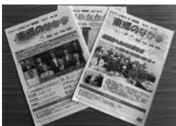
シニア世代の就労支援センター

【企画部長】来年度、関係部局を通じ、文化財保護委員や有識者の意見を聞き、前回の編纂体制を参考に構成イメージなど基本的な方向性を検討したい。