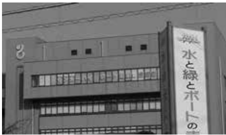
役場4階に掲げられる総体のPR掲示

町は様々な階層の住民への情報発信を努める責務がある。今後は広報とHPを基本として、他のツールも効果的に活用し、わかりやすい情報発信を意識したい。