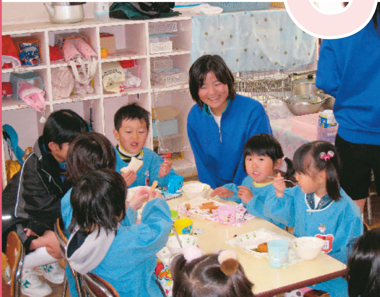
中学生の職場体験(音貝保育園にて)