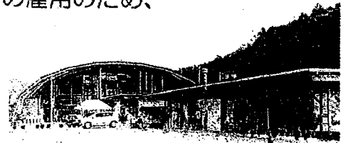
道の駅「もっくる新城」

東郷町に本当に「道の駅」は必要なのでしょうか。 全国に1093ある「道の駅」の多くは赤字であり、 その補てんを市町村がしている現状があります。