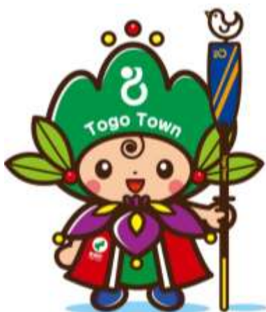
東郷町イメージキャラクター トッピー