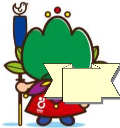
東郷町イメージキャラクター トッピー