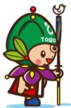
東郷町イメージキャラクター トッピー