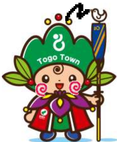
東郷町イメージキャラクター トッピー