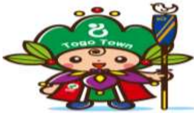
東郷町イメージキャラクター トッピー

「トッピー」のイラスト等を縮小又は拡大して使用する場合、縦横の比率を変更しないでください。