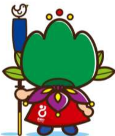
東郷町イメージキャラクター トッピー