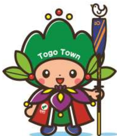
東郷町イメージキャラクター トッピー