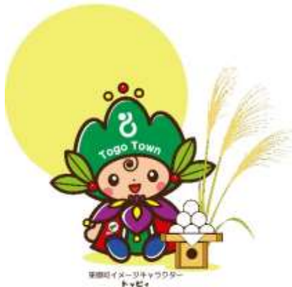
東郷町イメージキャラクター トッピー

「トッピー」のデザイン画に「トッピー」以外のイラストが重なっていますが、周辺のイラストも含めて1つの作品となっているため、重ね合わせには当たりません。