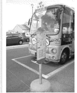
東郷町巡回バス停留所

27 名古屋記念病院 名古屋市営地下鉄鶴舞線「平針駅」から、南へ徒歩約5分。名鉄豊田線「日進駅」、「米野木駅」から乗車可。